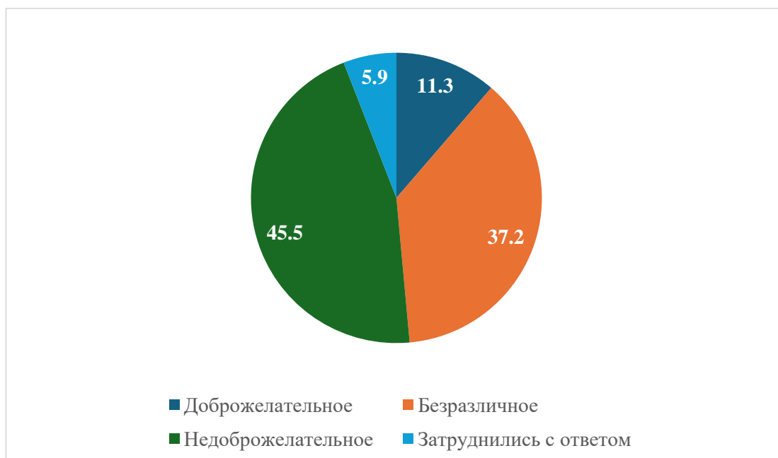
Рис.2. Оценка отношения жителей региона к мигрантам, Ростовская область, 2024-2025 гг., %