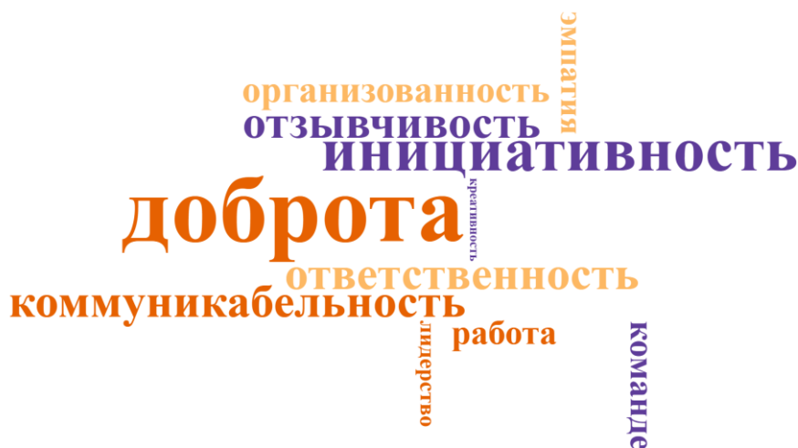
Рисунок 1. Качества организаторов добровольческой (волонтерской) деятельности

В группе морально-этических качеств респондентами связываются «доброта», «отзывчивость», «эмпатия», «бескорыстие». Например, цитата: «Доброта, отзывчивость и желание помогать безвозмездно» . В группе организационно-лидерских качеств респондентами увязываются между собой такие качества как «ответственность», «коммуникабельность», «лидерство», «работа в команде». Например, цитата: «Ответственный лидер, умеющий организовать команду» . Наконец, группа адаптивных качеств состоит из взаимосвязей между «стрессоустойчивостью», «гибкостью», «креативностью». Например, цитата: «Гибкость и стрессоустойчивость в нестандартных ситуациях» .