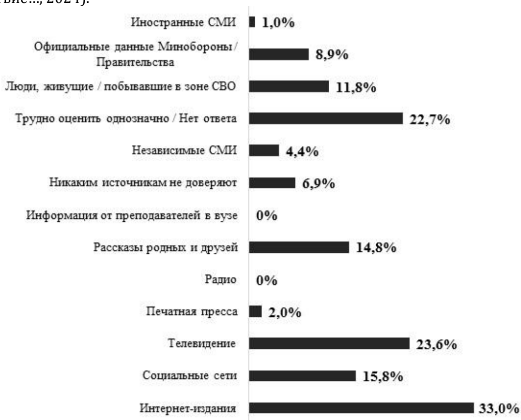
Рис. 1. Доверие студентов Ростовской области различным источникам информации о ходе СВО, данные ЦСПИ ЮФУ, 2022 г., в % (Социальное самочувствие..., 2024)

Как показали данные, полученные ЦСПИ ЮФУ осенью 2022 года в ходе анализа студенческих эссе, молодые люди испытывают определенные трудности в отношении доверия к тем или иным каналам информации – 22,7% затруднились с ответом на этот вопрос (рис. 1). У остальных респондентов наибольшее доверие вызывают данные о ходе СВО, транслируемые в интернет-изданиях (33%), на телевидении (23,6%) и в социальных сетях (15,8%). Значим и коммуникативной фактор: 14,8% доверяют информации, услышанной от родственников и друзей, а 11,8% считают, что правду можно узнать от тех, кто лично был в зоне боевых действий. Весьма удручает тот факт, что преподаватели в университете не являются для студентов доверенным источником данных (Социальное самочувствие..., 2024).